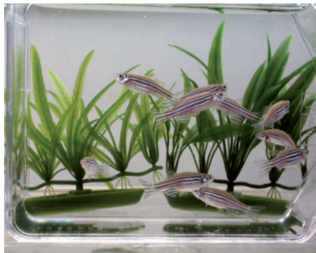
Figure 1: Zebrafish