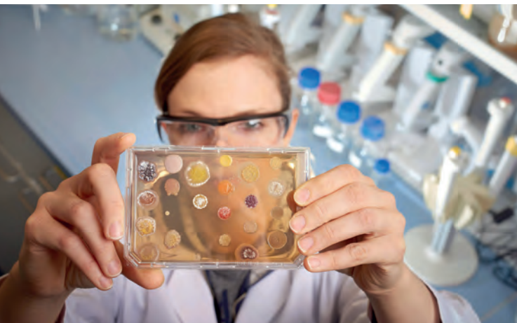
Für die gemeinsame Forschung zu neuen Antiinfektiva teilt Sanofi mit Fraunhofer eine der größten Stammsammlungen der Welt.

Austausch zum Forschungsstand im Vorfeld des G7-Gipfels